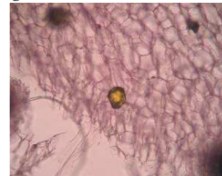
Hình 1: Tế bào tiết (màu vàng) ở thân rễ gừng trâu

Tinh dầu gừng dại có hàm lượng tinh dầu cao hơn ( \alpha=0,05 ): hiệu suất chiết tính trên củ tươi của gừng dại là 0,47%, gừng trâu là 0,19%. Điều này khá phù hợp khi so sánh đặc điểm vi phẫu, thì thân rễ gừng dại có nhiều tế bào tiết hơn thân rễ gừng trâu.